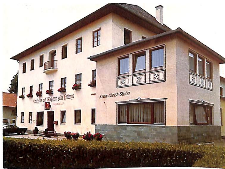
Gasthof und Metzgerei Neuwirth mit Lena-Christ-Stube

Die Bemühungen um die Schönheit und Gepflegtheit des Ortsbildes wurden bereits durch das Land Bayern, anlässlich eines Wettbewerbes, ausgezeichnet. Vielleicht fällt dem Gast bei einem Ortsrundgang auch die Gedenktafel am Geburtshaus der Dichterin Lena-Christ und die des Chirurgen Professor Lebsche