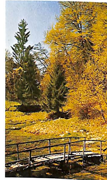
„Ursprung“, das Quellgebiet der Glonn mit ca. 30 Quellen

auf. In der Umgebung gibt es interessante Kapellen und Kirchen, sowie romantische Naturschutzgebiete.