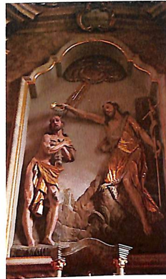
Hochaltar in der Pfarrkirche (Figuren von Götsch, einem Günther-Schüler)