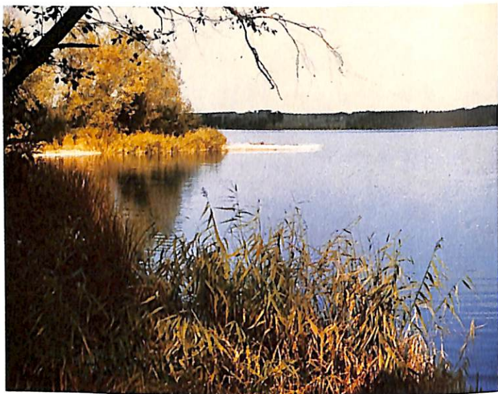
Der Steinsee; Wald, Wiesen, Moor und ein großes Freibad