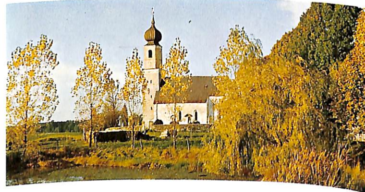
Kirchlein Kreuz (ca. 1200)

Machen Sie ruhig einmal den Versuch mit Glonn. Gute Luft, angenehme Gastlichkeit und mäßige Preise bietet es im Überfluß. Was es nicht gibt, sind Industrie und Nachtleben. Aber darauf können unsere Gäste ruhig verzichten.