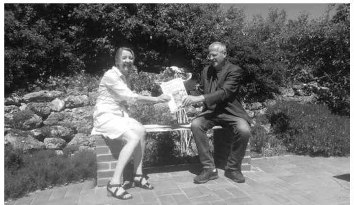
Die symbolische Übergabe des Marktschreibers.