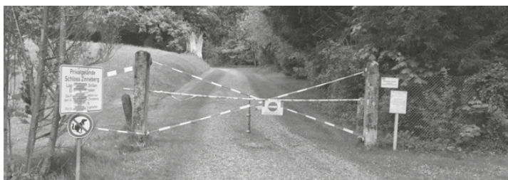
Absperrungen auf dem Gelände des Schlosses Zinneberg werden oft mutwillig durchbrochen.

Sr. Christophora Eckl, Schloss Zinneberg, Einrichtungsleitung