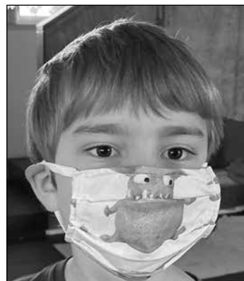
Das Tragen von Masken soll helfen, das Coronavirus einzudämmen.

RAPHAELWEG 13 / 85625 PIUSHEIM BEI GLONN IM AMANU/ TELEFON 08093/690