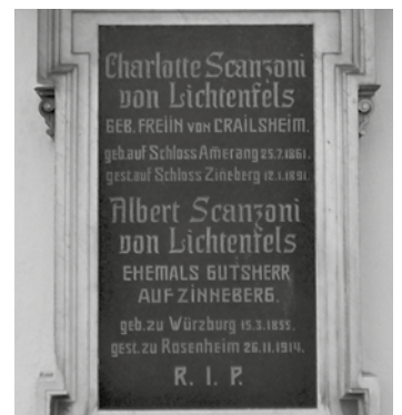
Die Grabplatte der Scanzonis. Sie ist nordseitig an der Außenwand der Kirche, neben dem Eingang in die Sakristei, befestigt.

Vier seiner ehemaligen Bediensteten trugen ihn in seinem Familiengrab in Glonn unter großer Anteilnahme der Bevölkerung zu Grabe. Er, der