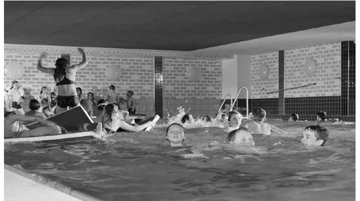
Die Hallenbaddischo wird von der Wasserwachtsgruppe aus Glonn ca. 2 Mal im Jahr veranstaltet.