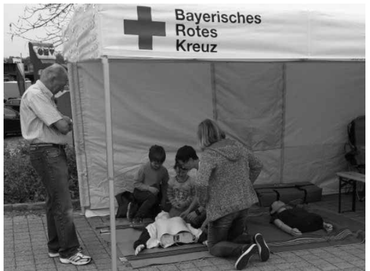
Am Weltrotkreuztag, dem 08.05.2019, war die BRK Bereitschaft Glonn von 16:00-18:00 Uhr in Glonn, am Parkplatz am Penny-Supermarkt in der Pfarrer-Winhart-Straße 3 mit einem Infostand und bildete neue "Herzensretter" aus. Die „Herzensretter“-Initiative ist eine Möglichkeit, kurz und bündig nur die lebensrettenden Maßnahmen bei einem Herz-Kreislaufstillstand zu erlernen und zu üben.