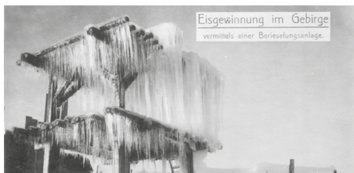
Eisgewinnung im Gebirge vermittels einer Berieselungsanlage.